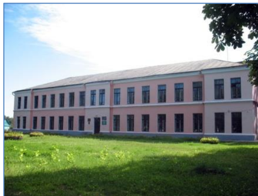
Фото 2. Здание ГУО «Вилейский районный центр дополнительного образования детей и молодёжи»