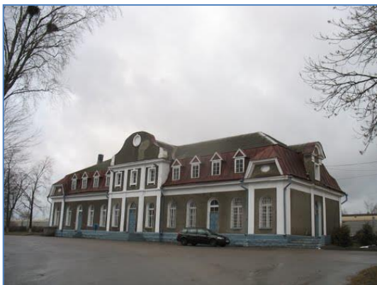
Фото 1. Здание железнодорожного вокзала