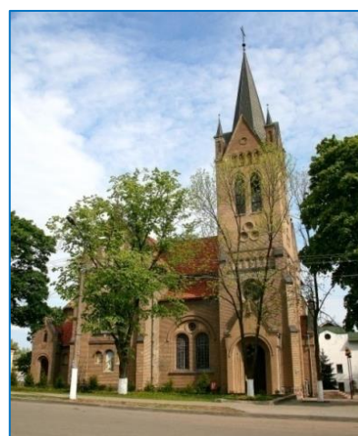
Фото 4. Римско-католический Крестовоздвиженский костел