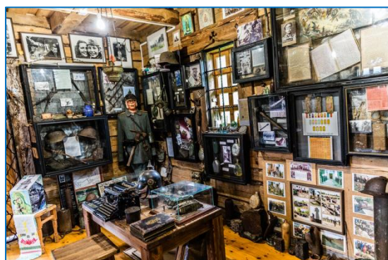
Фото 6. Музей Первой мировой войны в д.Забродье