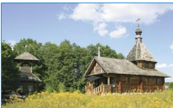
Фото 5. д.Забродье. Мемориально-этнографический комплекс Забродье